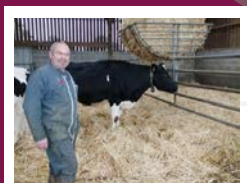
EARL LA GLAIVERIE Groupe lait

J'ai osé investir 12 €/VL dans un minéral «spécial tarie» et changer mes pratiques de tarissement :